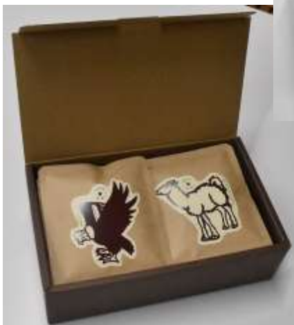
ギフトボックス 10個セット