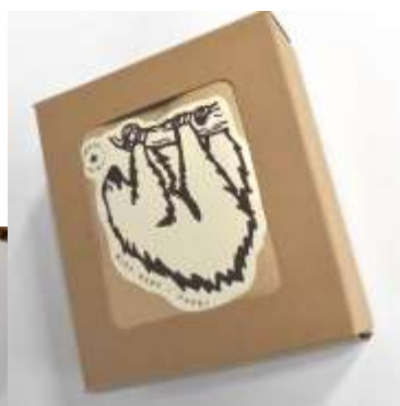
窓付き箱入り5個セット

ペルーに生きる多様な動物たち。 可能性や多様性を認める地域づくりを目指す 私たちポラリスのメッセージを ペルーの動物それぞれの個性になぞり お届けします。